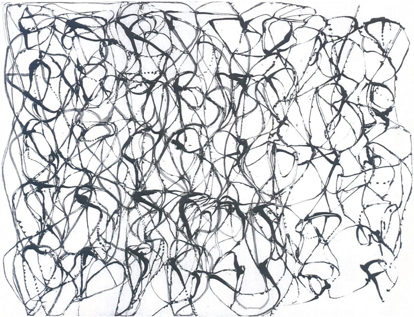
Brice Marden (1938-), Cold Mountain Series, Zen Study 1 (1991) Etching and aquatint on paper 525 × 690 mm Tate Modern, London