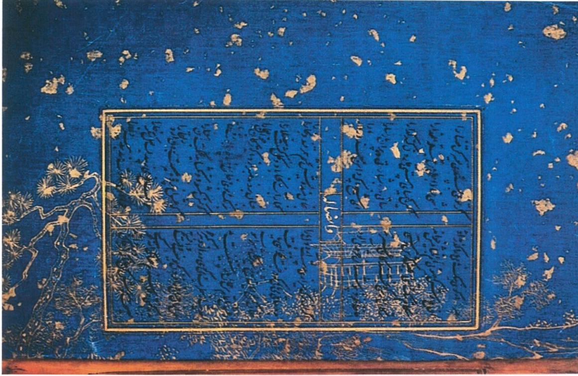
Folio from a Divan (Collected poem) of Hafiz on Chinese coloured paper. Copied in 1451, probably at Herat in Afghanistan. British Library.