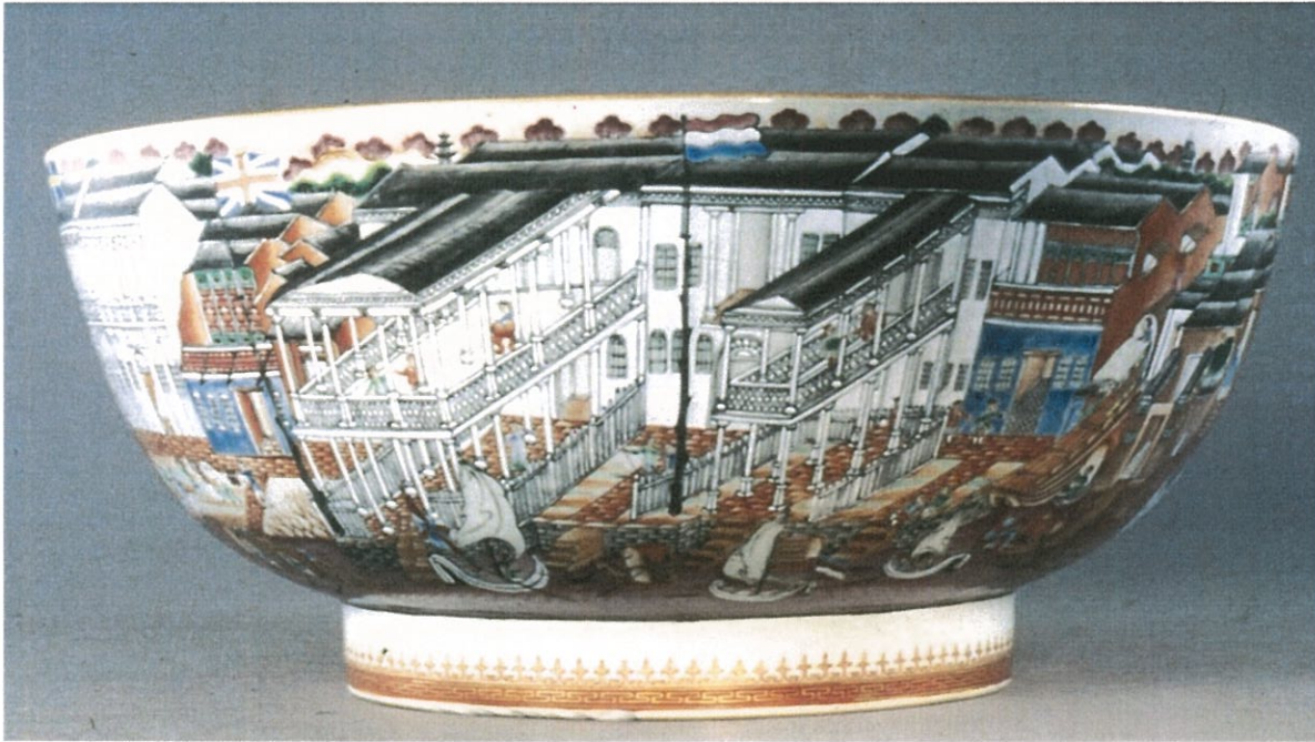
廣彩瓷大碗 18 世紀晚期 大英博物館藏 口徑 36.60 公分 高 15.7 公分