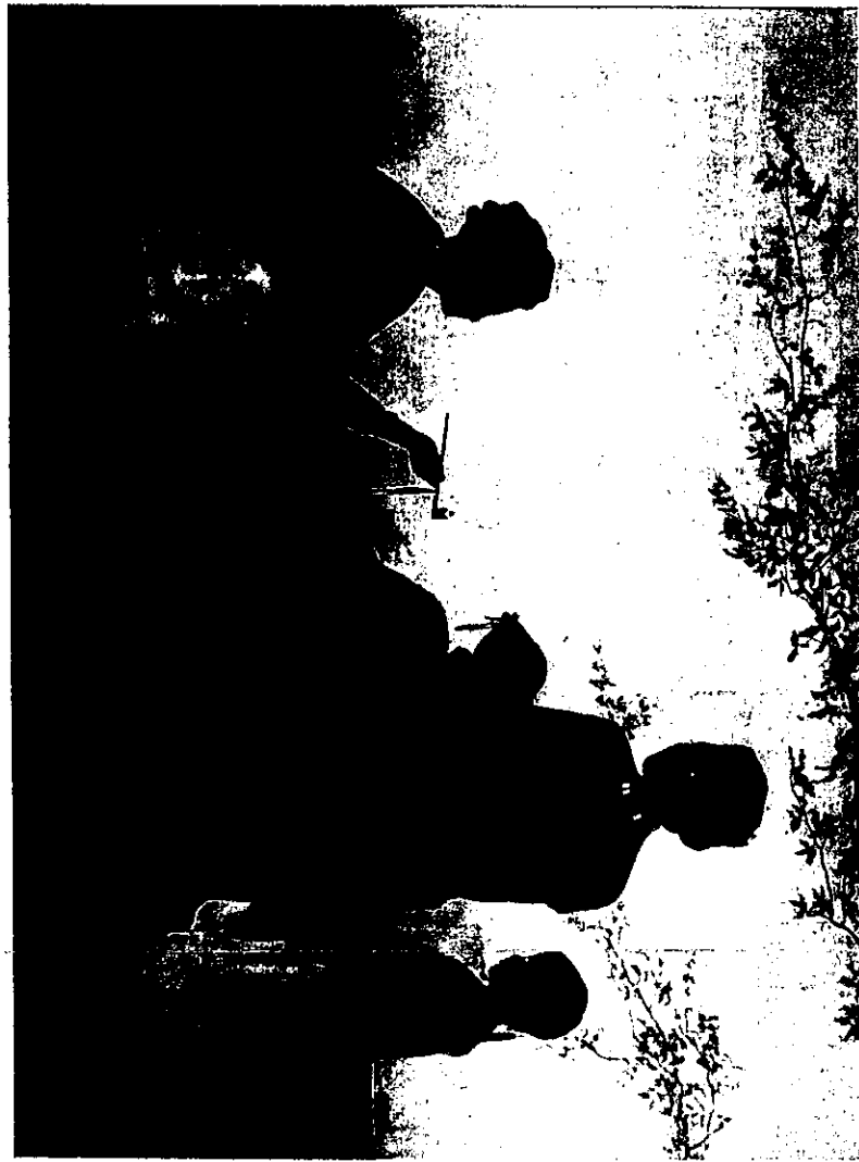
d. 陳進，三地門社之女，1936 147.7 x 199.1 公分 絹本膠彩 福岡亞洲美術館